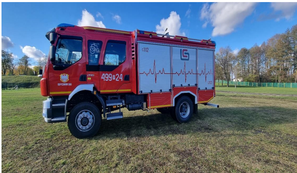
Rysunek 3 Nowy samochód OSP Czarny Sad

W budżecie miasta i gminy Koźmin Wielkopolski na 2023r. przeznaczono na ochronę przeciwpożarową kwotę 982 456,00 zł (w tym 700 000,00 zł dotacja dla OSP Czarny Sad na zakup średniego samochodu ratowniczo-gaśniczego), z czego wykorzystano kwotę 905 537,88 zł (w tym 691 415,00 zł dotacja dla OSP Czarny Sad na zakup średniego samochodu ratowniczo-gaśniczego).