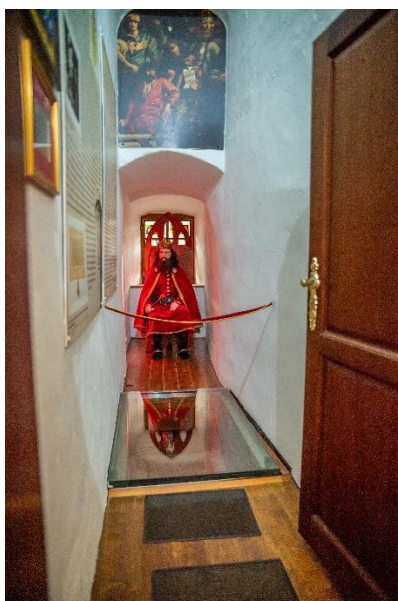
Rysunek 2,3 Remont w Muzeum Ziemi Koźmińskiej