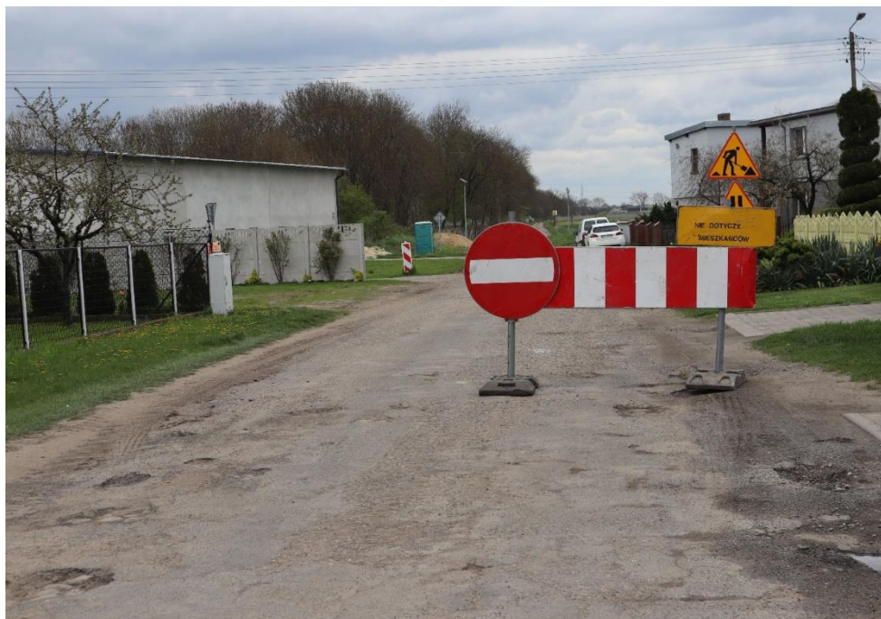
Rysunek 10 Droga Czarny Sad - Lipowiec w trakcie remontu