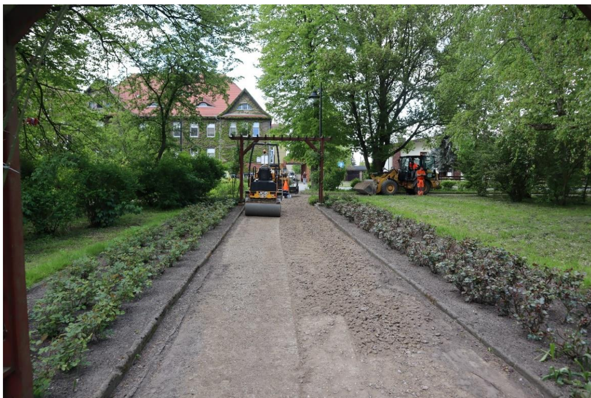
Rysunek 1 Rewitalizacja Parku im. Powstańców Wielkopolskich

W 2023 r. gmina Koźmin Wielkopolski zakończyła rewitalizację zieleni miejskiej, którą rozpoczęto w 2022 r. Zadanie było realizowane na terenach zieleni miejskiej takich jak: Park Powstańców Wielkopolskich, Park Nowy Rynek, Park Jana Pawła II, Park Przyjaźni Polsko – Holenderskiej, Park przy ul. Dworcowej, Skwer Wielkiej Orkiestry Świątecznej Pomocy, oraz zielen wokół Urzędu Miasta i Gminy przy ul. Boreckiej 23. Prace polegały na wykonaniu odmładzających przycięć krzewów, prześwietlaniu koron drzew, usuwaniu suchych konarów i gałęzi, założeniu nowych trawników, wykonaniu nowych nasadzeń drzew i krzewów, wymianie ławek parkowych i koszy na śmieci, wymianie obrzeży parkowych oraz utwardzenie mieszanką mineralną alejek spacerowych, wykonanie woliery dla ptactwa. Zadanie było dofinansowane z Programu Rządowy Fundusz Polski Ład: Program Inwestycji Strategicznych – edycja pierwsza. Całkowity koszt zadania to 2 018 486,02 zł, z czego kwota dofinansowania to kwota 1 800 000,00 zł z dofinansowanie z Rządowego Funduszu Polski Ład: Program Inwestycji Strategicznych- edycja pierwsza. Kwota wydatkowa w 2023 r. to 1 014 822,29 zł.