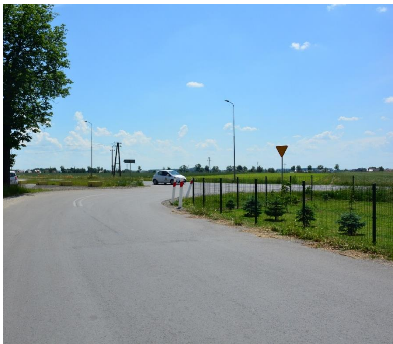
Rysunek 13 Skrzyżowanie drogi wojewódzkiej z drogą gminną po przebudowie

nowego normatywnego wlotu drogi gminnej pod kątem 90 stopni do drogi wojewódzkiej. Rozbudowa drogi gminnej polegała na poszerzeniu do 6,00 m na długości 228,00m. Całkowity koszt : 491 675,86 zł. Dofinansowanie: 273 504,00 zł z Rządowego Funduszu Rozwoju Dróg.