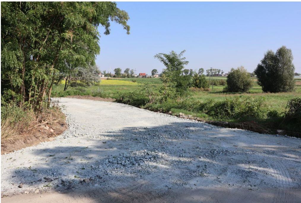
Rysunek 11 i 12 Modernizacja drogi w Staniewie