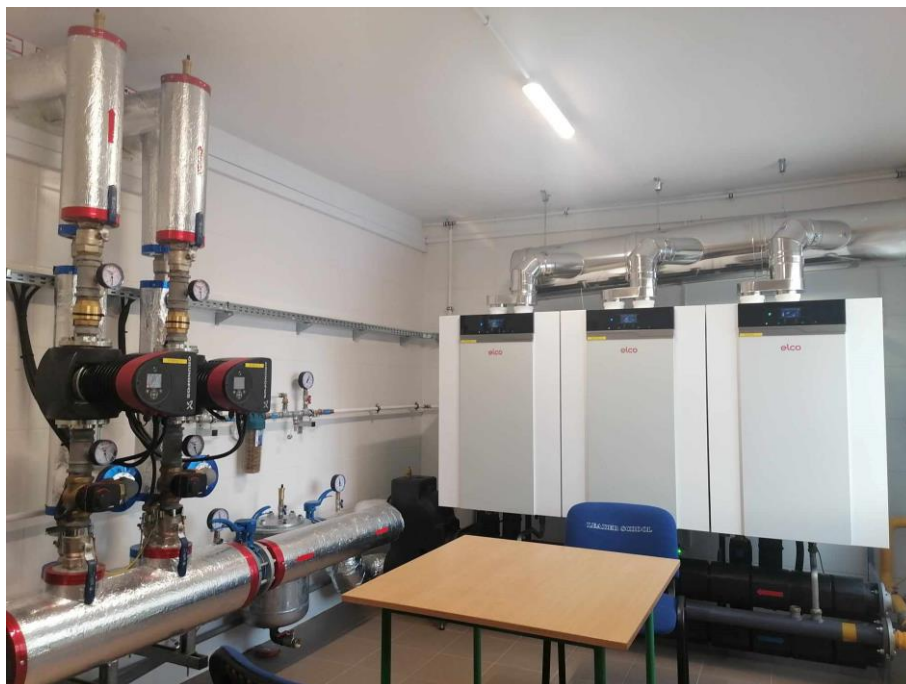
Rysunek 7 Nowoczesna kotłownia w SP NR 1