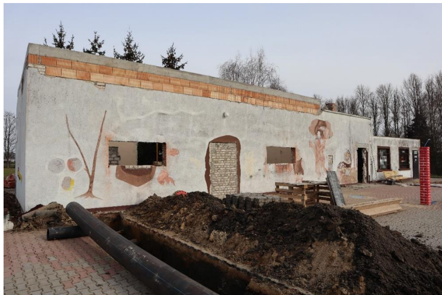
Rysunek 5 Modernizacja systemu uzdatniania wody na basenie