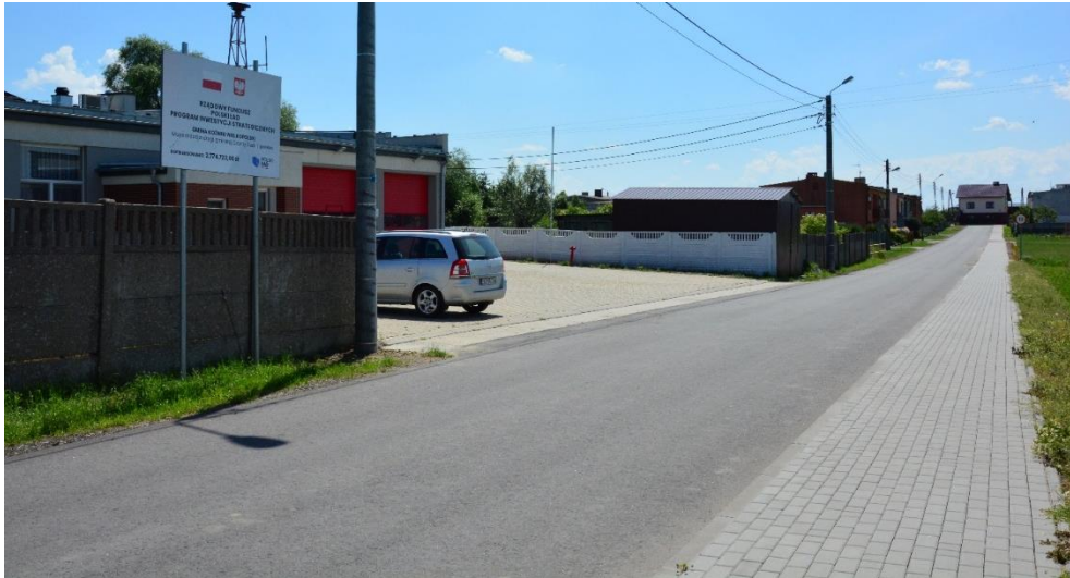
Rysunek 9 Zdjęcie drogi Czarny Sad - Lipowiec po remoncie

Inwestycja polegała na położeniu nakładki asfaltowej na długości 3289 m oraz poszerzeniu jezdni do 5 m w miejscach, gdzie droga była węższa, a także remoncie chodnika na długości 607,6 m. Całkowita wartość zadania 2 932 426,47 zł, z czego kwota dofinansowania to 2 774 723,00 zł. Dofinansowanie z Rządowego Funduszu Polski Ład: Program Inwestycji Strategicznych- edycja druga.