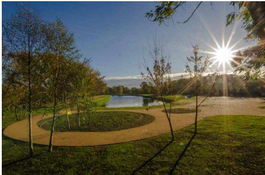
Rysunek 4 Park Doliny Orli

W 2023 r. w dolinie rzeki Orli rozpoczęła się budowa Parku Doliny Orli. Przy ul. Krotoszyńskiej został wykopany staw o powierzchni 7 tys. mkw., a wokół zbiornika i w kierunku ul. Grębowskiej wytyczono ścieżki rekreacyjne, wyremontowano jaz na rzece Orli i inne urządzenia wodne. To drugi etap realizacji projektu "Budowa Parku Doliny Orli wraz z przebudową basenu", na który gmina Koźmin Wielkopolski pozyskała dofinansowanie w wysokości 4.050.000 zł z Rządowego Funduszu Polski Ład: Program Inwestycji Strategicznych – edycja pierwsza. W pierwszym etapie został przebudowany budynek techniczny stacji uzdatniania wody i zmodernizowany system uzdatniania wody na koźmińskim basenie przy ul. Pleszewskiej. Dzięki tej inwestycji miejski basen został wyposażony w nowy, bezawaryjny, automatyczny system pomp i zasuw. Wyremontowano również pomieszczenie socjalne dla ratowników. Koszt całkowity zadania to 4 979 918,59 zł.