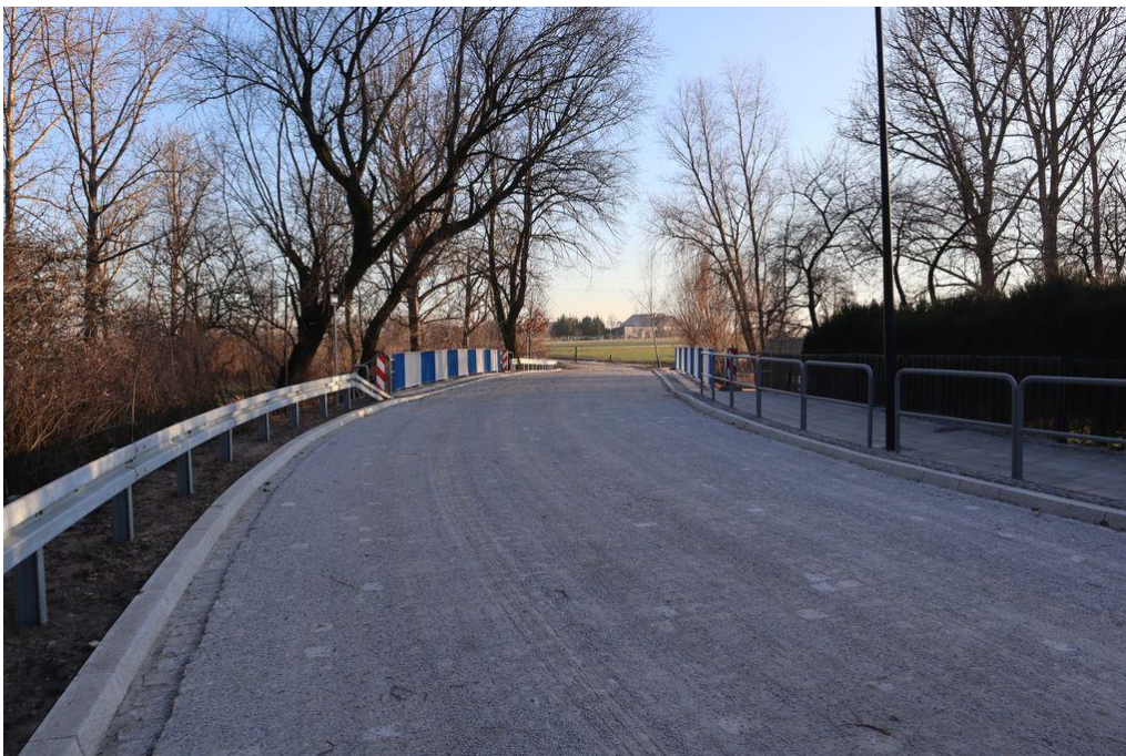
Rysunek 14, 15 Modernizacja ulicy Grębowskiej