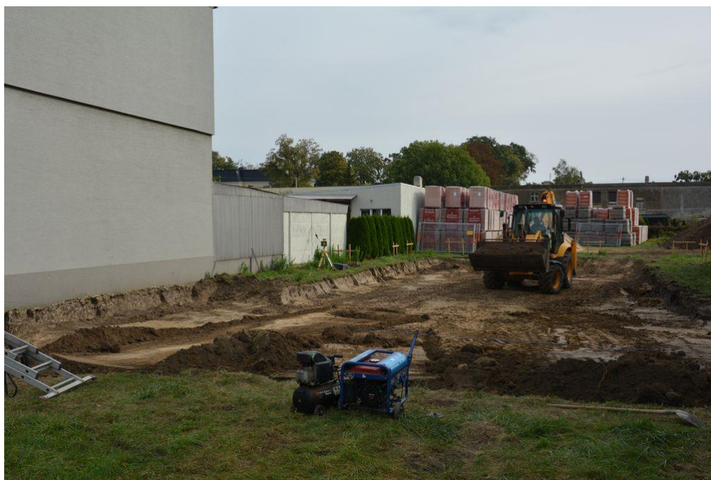
Rysunek 6 Budowa centrum opiekuńczo-mieszkaniowego w Koźminie Wielkopolskim

W 2023 r. rozpoczęła się budowa centrum opiekuńczo-mieszkalnego przy ul. Marcińca. Będzie to placówka dla dorosłych osób niepełnosprawnych, zapewniająca warunki pobytu dziennego i całodobowego. W projekcie przewidziano utworzenie pokoi do pobytu całodobowego i części dziennej, w której osoby korzystające z obiektu będą miały zapewniony posiłek oraz wsparcie w zakresie potrzeb zdrowotnych, pielęgnacyjnych i rehabilitacyjnych. Zakończenie prac budowlanych jest przewidziane na wrzesień 2024 r., a otwarcie centrum na początek 2025 roku. Gmina pozyskała na budowę tego obiektu 2 030 793,45 zł ze środków Solidarnościowego Funduszu Wsparcia Osób Niepełnosprawnych. Wartość całkowita zadania to 3 390 550,87 zł. Kwota wydatkowana w 2023 r. – 1 015 396,72 zł ( z funduszu ) ze środków własnych 11 070, 00 zł.