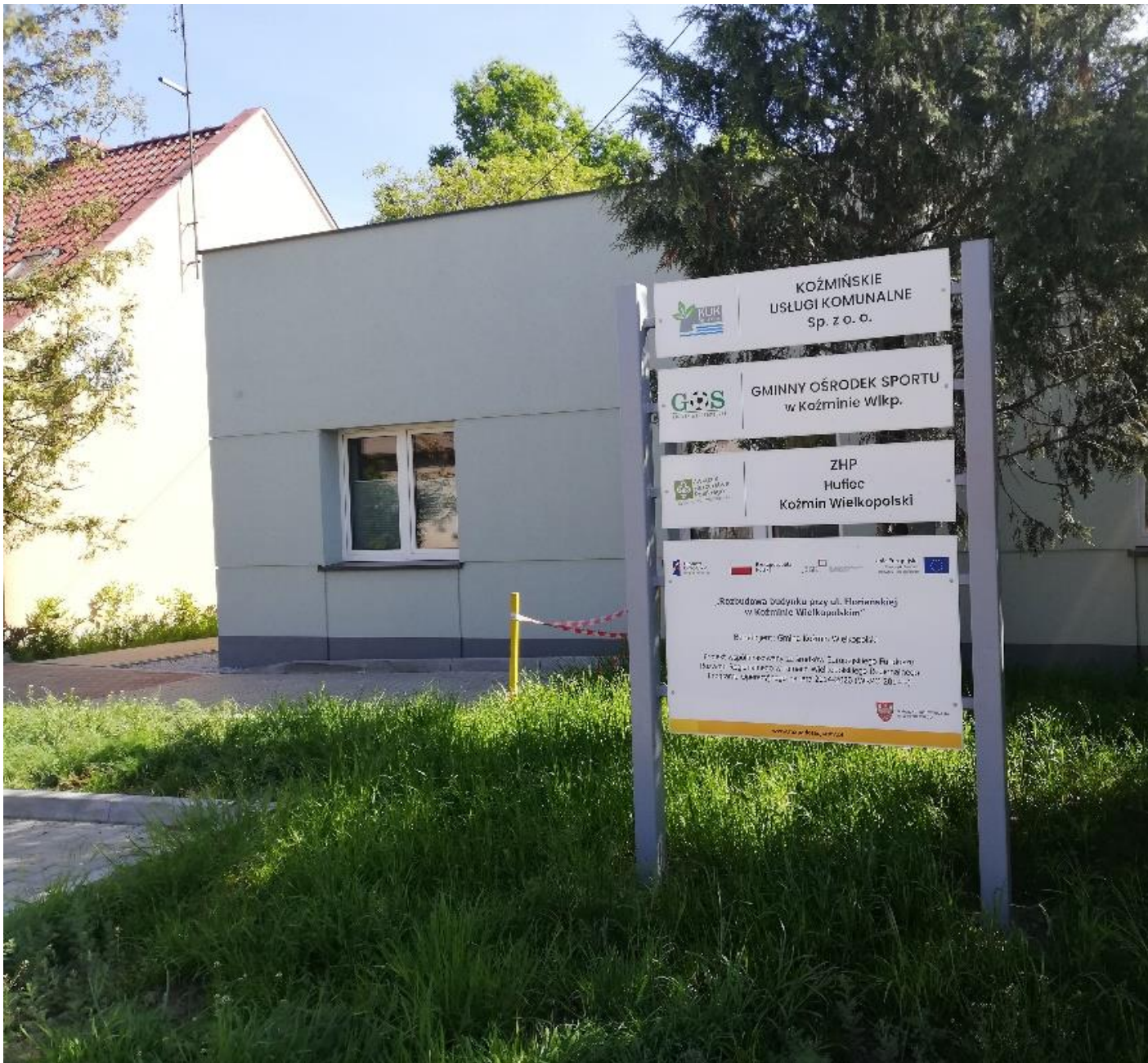
Rysunek 8 Budynek biurowy przy Floriańskiej po remoncie

W 2023 r. zakończyła się inwestycja „Rozbudowa budynku przy ul. Floriańskiej w Koźminie Wielkopolskim” w ramach WRPO na lata 2024-2020 (JESSICA 2). W 2022 roku gmina Koźmin Wielkopolski przystąpiła do przebudowy i rozbudowy tego obiektu. To pierwszy w jego historii kompleksowy remont. Na realizację zadania samorząd zaciągnął preferencyjną pożyczkę w Banku Gospodarstwa Krajowego w wysokości 2,5 mln zł. Pozostałe środki zostały zabezpieczone w budżecie Miasta i Gminy Koźmin Wielkopolski. Kwota wydatkowana w 2023 - 2 756 415,78 zł Koszt całkowity inwestycji to – 3 825 547,99 zł.